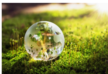
Unsere Umwelt & CO2 Bilanz

Diese ESG-Zielstellung geht mittel- und langfristig mit unseren ökonomischen Zielen einher und unterstützt diese. Weitere Informationen über unsere allgemeinen strategischen Entwicklungen auf dem Weg zu mehr Nachhaltigkeit finden Sie hier: