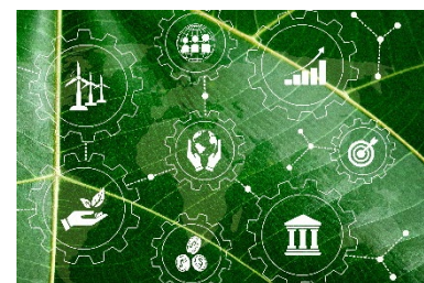
Unsere Werte zur Unternehmensführung

Unsere freiwillig gesteckten Ziele und Maßnahmen werden mit definierten ESG-Zielen für 2025 in Einklang gebracht, nachvollziehbar und messbar kommuniziert.